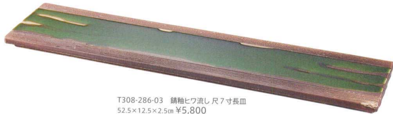
T308-286-03 錆軸ヒワ流し 尺7寸長皿 52.5×12.5×2.5cm ¥5,800