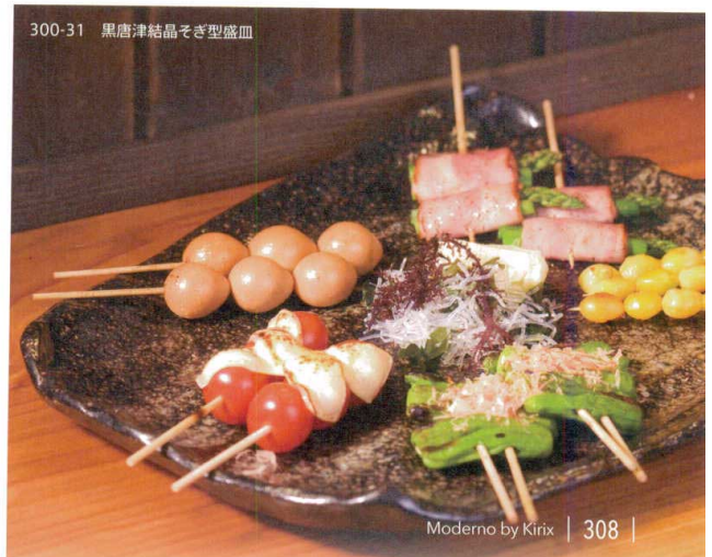
300-31 黒唐津結晶そぎ型盛皿