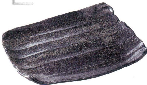
磁器 T308-300-31 黒唐津結晶そぎ型盛皿 37×29×H3.3cm ¥5,800