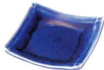
T326-300-49 紺瑠璃 10.5角皿 10.5×10.5×H2.5cm ¥520