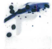
T326-IM01 イルマーレ スクエアプレート10 10×10×H2.1cm(内寸4.5×4.5) ¥950