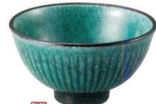
陶器 T346-911-0310 翠(みどり)飯碗 φ12.0×H6.3cm ¥1,280