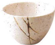
T346-312-21 乱刷毛 小丼 φ10.5×H6.8cm ¥930