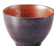
T346-309-03 明神ブチ丼 φ10.3×H7.2cm ¥460