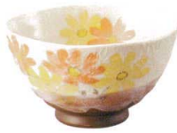
T346-8666-3302 FLORA(OR)飯碗 φ11.6×H6.6cm ¥1,000