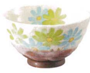
T346-8666-3301 FLORA(GR)飯碗 φ11.6×H6.6cm ¥1,000