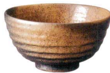
T346-02-25 黒備前飯碗(大) φ12.5×H6.5cm ¥680