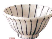
陶器 T346-290-6001 ゴス十草 変形茶碗 φ12×H6.2cm ¥750