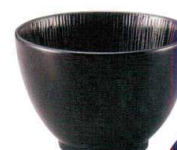
T346-DN44 ライスボウル10 10.3×H7.2cm ¥460