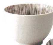
T346-DN14 ライスボウル10 10.3×H7.2cm ¥460