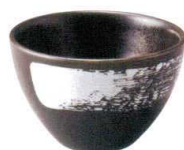
T346-312-22 白刷毛 小丼 φ10.5×H6.8cm ¥930