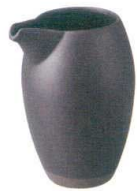
T353-957-0101 JAPAN-BLACK 片口冷酒 φ7.7×H11.8cm・370cc ¥1,850