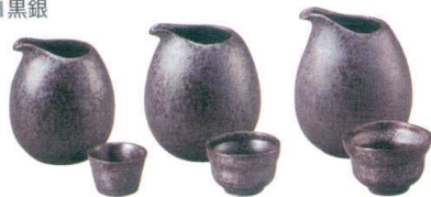
T353-79-83 黒銀 冷酒(小) 6.2×H7.2cm・120cc ¥1,060 T353-79-82 黒銀 冷酒(中) 7.3×H8.4cm・230cc ¥1,160 T353-79-81 黒銀 冷酒(大) 8.0×H10.3cm・300cc ¥1,380 T353-79-86 黒銀グイ呑 4.7×H3.1cm・40cc ¥500 T353-79-85 黒銀丸グイ呑 5.8×H3.8cm・60cc ¥500 T353-79-84 黒銀波測グイ呑 7×H4.6cm・90cc ¥530