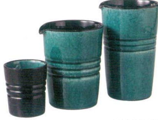
T353-911-2217 みどり 高台くい呑 φ5.5×H6.8cm・60cc ¥1,450