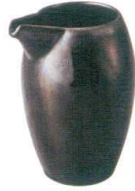
T353-957-0521 黒結晶 片口冷酒 φ7.7×H11.8cm・370cc ¥1,850