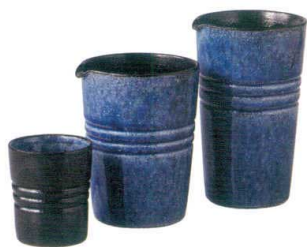
T353-911-2417 青釉 高台くい呑 φ5.5×H6.8cm・60cc ¥1,450