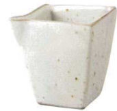
T353-290-5401 粉引青磁 角冷酒器 8×8×9cm・300cc ¥2,250 526520654