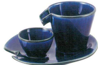
T353-290-5220 茄子紺しずく冷酒器 9.2×8.2×6.8cm・120cc ¥1,250 927211052 T353-290-5221 茄子紺しずくちび盃 6×3.8cm・30cc ¥550 927211152 T353-290-5222 茄子紺受皿 15.8×15.2×2cm ¥1,050 927211252