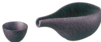
T353-290-1503 鉄ペーパーちび盃 5.8×H3.5cm ¥420 526450615