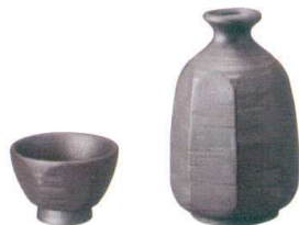
T353-290-5404 黒備前 八角くい呑 6×4.5cm ¥900 526630254