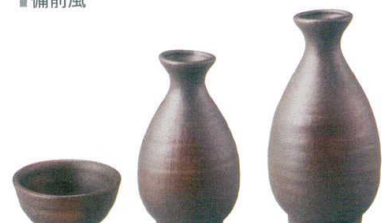
T353-79-89 備前風盃 φ6.3×3.5cm ・50cc ¥470