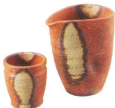
T353-290-5224 伊賀火色冷酒盃 5.7×6.5cm ¥840 526430452 T353-290-5223 伊賀火色冷酒器 9.5×7.8×11cm・300cc ¥1,800 526430352