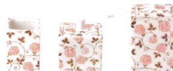
T354-18-103 ローズピンク 角楊枝入 3.7×3.7×H5cm ¥1,200