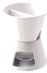
〈組み合わせ例〉 MSP0101 + MSP0102