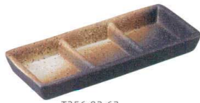
T356-02-62 黒備前三品薬味皿(小) 17.2×7.2×H2.6cm ¥1,090