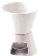
〈組み合わせ例〉 MSP0103 + MSP0102