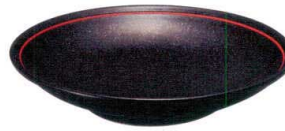
T362-GY009 フカヒレスーププレート 24.4×H5cm ¥950