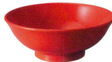
T362-21-127 高台6.8丼(赤) 20.5×H8.4cm・1,250cc ¥1,600 7619475R