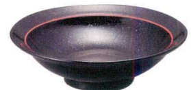
T362-GY026 丸高台7寸皿 22×H6.7cm ¥1,150