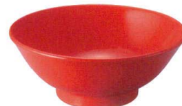
T362-21-124 高台7.0丼(赤) φ21.4×H8.6cm・1,400cc ¥1,700 0003075R