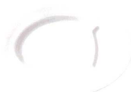
T370-21-161 9.0ギョウザ皿 22.8×H16.6cm ¥1,350 690-32-639