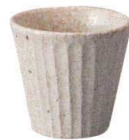
T396-003-0022 しのぎロック 9.2×H8.6cm・260cc ¥700