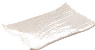
T396-003-0040 26cm角皿 26×17.6×H3.8cm ¥2,100