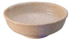
T396-003-561 玉測6.0寸浅井 19×H6.5cm ¥1,300