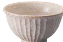
T396-003-0050 しのぎ5.0井 15.8×H9cm ¥950