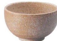
T396-003-553 4.2寸多用井 12.8×H8cm ¥700