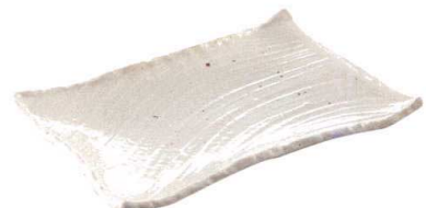
T396-003-0039 31cm角皿 31×21×H4.2cm ¥3,200