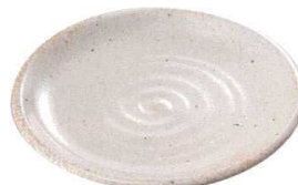
T396-003-507 7寸皿 22.9×H2.5cm ¥1,200