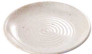
T396-003-509 9寸皿 26.8×H3cm ¥2,900