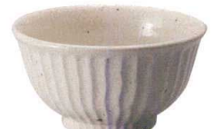
T396-003-0051 しのぎ5.5井 17.8×H9.5cm ¥1,200