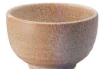
T396-003-554 5寸多用井 15.9×H10cm ¥1,100