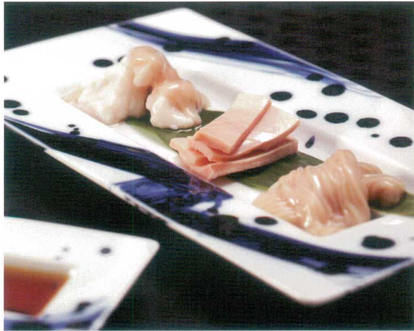
内臓三種盛り合わせ