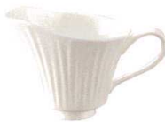
T044-EL002 クリーマー 150 12.8×7.6×8.1cm・150cc ¥1,800 (4/36) T044-EL006 15cmソーサー φ15×1.7cm ¥900 (4/36)