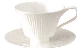
T044-EL008 カップ250 10×13×H7.5cm・250cc ¥1,200 (4/36) T044-EL006 15cmソーサー 15×H1.7cm ¥900 (4/36)