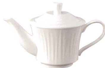
T044-EL001 ティーポット 22×11.5×H13.5cm・500cc ¥4,000 (1/8)