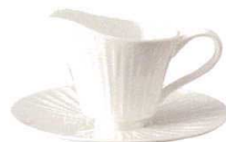
T044-EL003 クリーマー 60 9.5×6×H6.3cm・60cc ¥1,400 (4/72) T044-EL004 12cmソーサー φ12×1.5cm ¥700 (4/48)