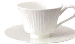
T044-EL007 カップ180 9×12×H7cm・180cc ¥1,100 (4/36) T044-EL006 15cmソーサー φ15×1.7cm ¥900 (4/36)