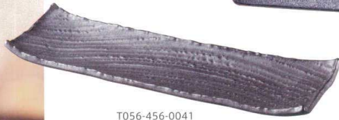
T056-456-0041 銀釉長角皿(大) 41×13×H4cm ¥4,600