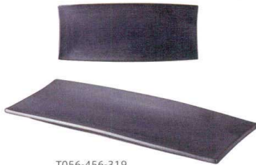
T056-456-319 銀釉平長角皿(大) 28.8×12.2×H1.8cm ¥2,700