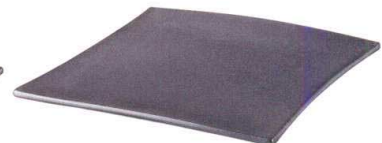
T056-456-314 銀釉平角皿(大) 25.3×H2cm ¥4,000