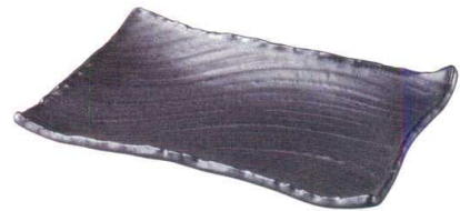
T056-456-0039 銀釉角皿(中) 31×21×H4cm ¥5,600