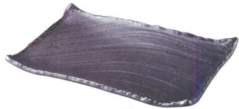
T056-456-0038 銀釉角皿(大) 37×24.5×H4cm ¥7,300