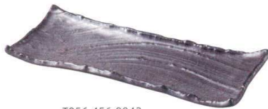
T056-456-0042 銀釉長角皿(中) 31×12.5×H3cm ¥3,000