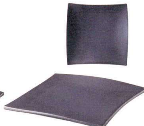
T056-456-315 銀釉平角皿(中) 19.1×H2cm ¥2,000