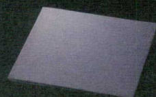
T059-CC505 20cm正角皿(天然石) 20.0×20.0×H0.7cm ¥2,600