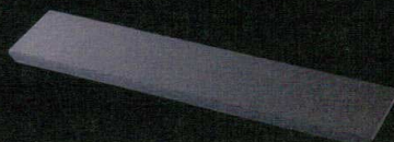
T059-CC503 35cmオードブルプレート(天然石) 35×8×H1.0cm ¥2,160