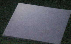
T059-CC506 23cm正角皿(天然石) 23×23×H0.7cm ¥3,200