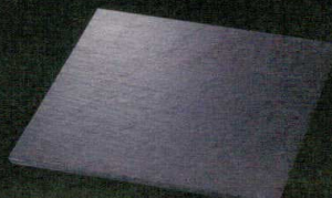
T059-CC508 27cm正角皿(天然石) 27×27×H0.7cm ¥4,200