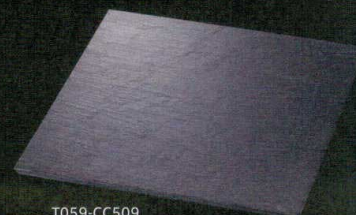
T059-CC509 30cm正角皿(天然石) 30×30×H0.7cm ¥5,300