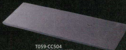
T059-CC504 40cm長角皿(天然石) 40×15×H1cm ¥3,300