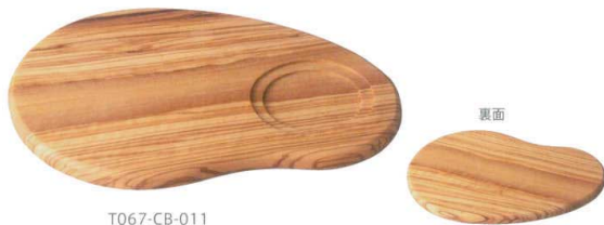
T067-CB-011 コクーンボード 240 オリーブ 24.0×16.8×H1.4cm ¥5,600