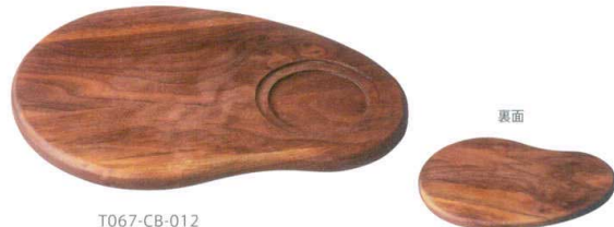
T067-CB-012 コクーンボード 240 ブラックウォルナット 24.0×16.8×H1.4cm ¥4,600