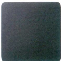
T069-10-412 19cmフラットトレイ 19×19×H1.5cm ¥2,500