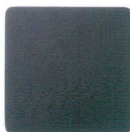
T069-10-411 15cmフラットトレイ 15×15×H1.5cm ¥1,900