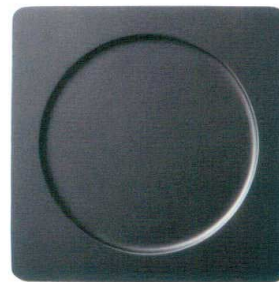
T069-10-313 23cm多用トレイ 23×23×H1.5cm (内寸φ18cm) ¥3,500