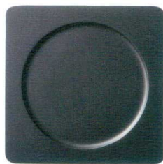
T069-10-312 19cm多用トレイ 19×19×H1.5cm (内寸φ15cm) ¥2,700