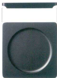
T069-10-311 15cm多用トレイ 15×15×H1.5cm (内寸φ12cm) ¥2,000