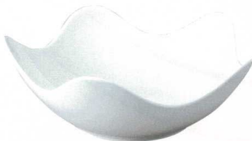
T077-49-603 31cmスターボウル 31×H11.3cm ¥4,700