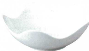
T077-49-602 26cmスターボウル 26×H9.5cm ¥3,500