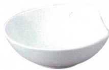
T077-49-608 20cm穴あきボウル φ20×H8cm ¥1,900