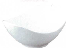
T077-49-606 27cmV型ボウル 27×20.5×H15.5cm ¥3,200