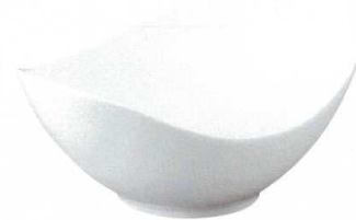
T077-49-607 33cmV型ボウル 33×23.8×H18.5cm ¥4,800