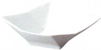
T077-49-152 折り紙ボールLL 28×28×H10cm ¥3,500 CHN