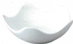
T077-49-601 20.5cmスターボウル 20.5×H7.5cm ¥2,100