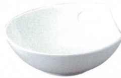
T077-49-609 25cm穴あきボウル φ25×H9cm ¥2,900