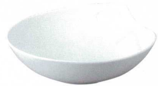
T077-49-610 30cm穴あきボウル φ29.7×H10.2cm ¥4,200