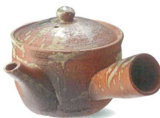
W315-03 ¥3,300 民芸急須(230cc) W160×D130×H95mm