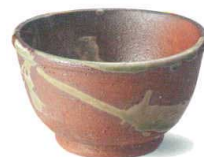
W315-04 ¥800 民芸汲出し φ90×H50mm