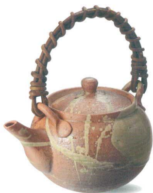
W315-07 ¥8,400 民芸土瓶(700cc) W180×D135×H120mm