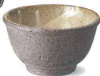
W315-02 ¥800 南部汲出し φ90×H50mm