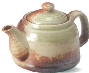
W315-05 ¥2,600 庄左エ門ポット(500cc) (茶こしアミ付) W190×D120×H110mm