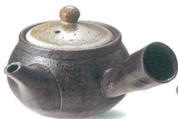
W315-01 ¥3,800 南部急須(290cc) W180×D145×H90mm