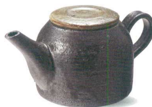
W315-06 ¥4,800 南部ポット(320cc) W175×D95×H75mm