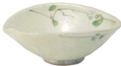
GB6-21-01 ベリー鉢 4,000円(+税) 約20.5×17×8cm、約600g(16入) ★Ktc-6