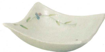
GB6-21-02 ベリー四方鉢 3,800円(+税) 約19×19×6cm、約500g(16入) ★Ktc-7