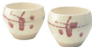
GB6-21-05 赤絵 マルチ鉢ペア 6,000円(+税) 約φ10×8cm、約350ml、約400g(24入) ★Ktc-10