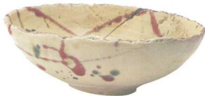
GB6-21-04 赤絵鉢 5,500円(+税) 約22×18×7.5cm、約600g(16入) ★Ktc-9