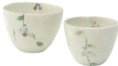
GB6-21-03 ベリーいれこカップ 5,000円(+税) カップ大(1):φ10.5×7.5cm、約320ml、 カップ小(1):φ9×6.5cm、約230ml、 約400g(18入) ★Ktc-8