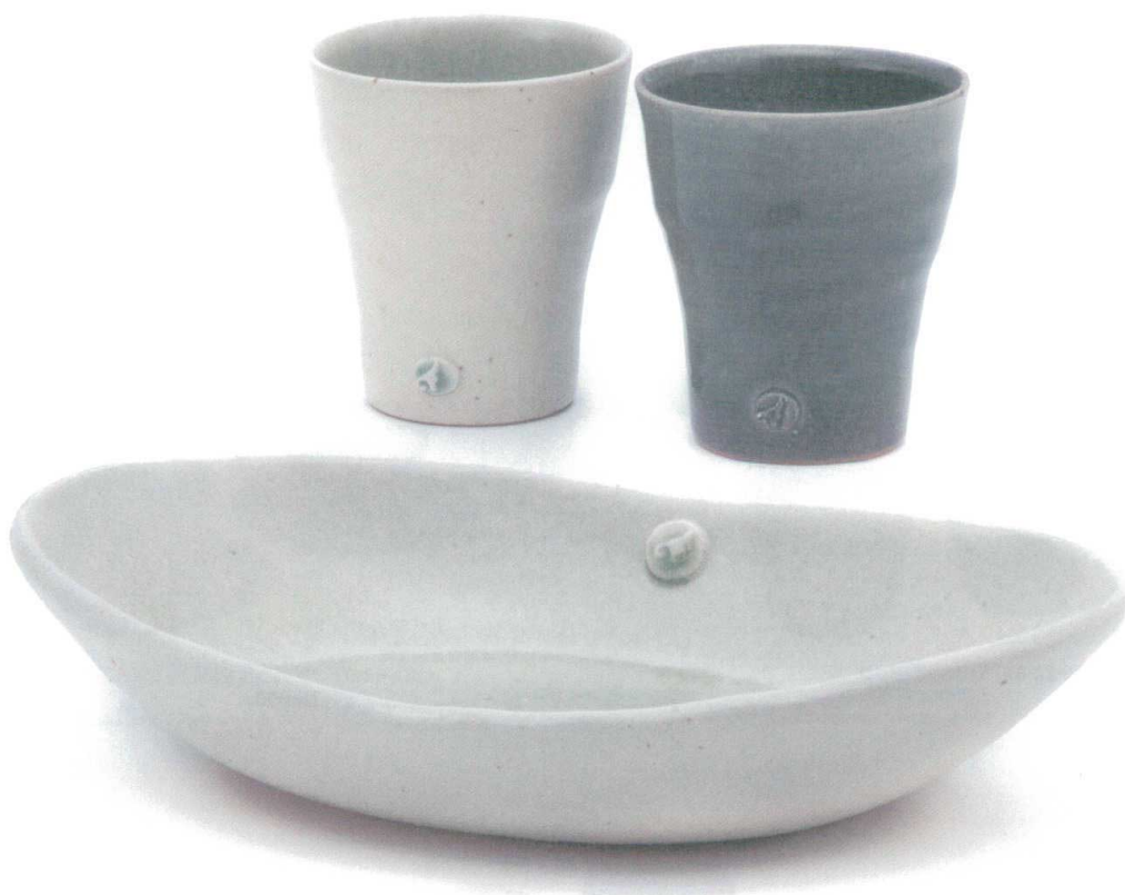
GB6-23-01 Angel ペアカップ 3,000円 (+税) 約φ8.5×9.5cm、約280ml、400g(24入) ★Ang-1

土ものの器がもつ手づくり感と 透明感のある色合いが優しい。 Angelの翼がほどこよいアクセントに。 心を落ち着かせるテーブルウエア。