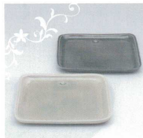
GB6-23-05 Angel ペアプレート 10,000円 (+税) 約20.5×20.5×2cm、1200g(10入) ★Ang-5