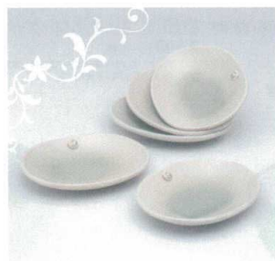
GB6-23-04 Angel 取分け皿揃 5,000円 (+税) 約15.5×12.5×2.5cm、1000g(12入) ★Ang-4