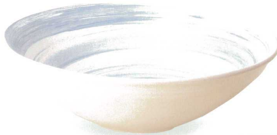
蒼流し手洗鉢 A039-03 W380×H120 ¥31,000 (税込¥34,100)