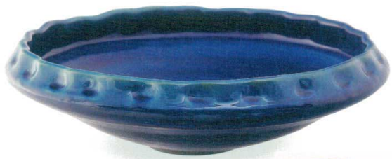
ブルーガラス手洗鉢 A039-02 W400×H110 ¥44,000 (税込¥48,400)