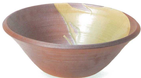
ビードロ流し手洗鉢 A039-05 W410×H150 ¥38,000 (税込¥41,800)