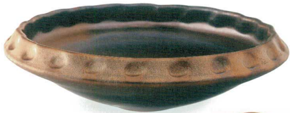
黒窯変金彩手洗鉢 A039-01 W400×H110 ¥44,000 (税込¥48,400)