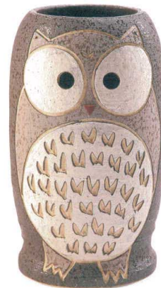
黒化粧ふくろう傘立 A058-06 W260×H435 ¥18,000 (税込¥19,800)