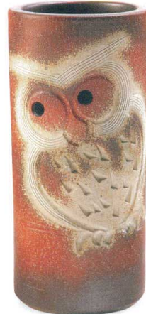
火色ふくろう傘立 A058-03 W215×H460 ¥10,000 (税込¥11,000)