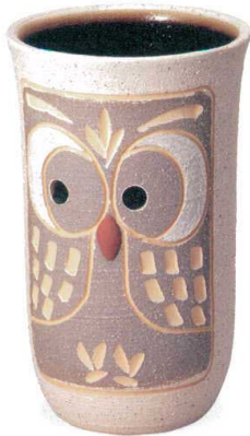
白ふくろう傘立 A058-04 W260×H420 ¥17,000 (税込¥18,700)