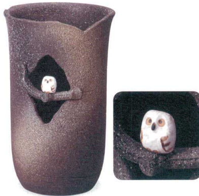
木のりふくろうソリ型傘立 A058-05 W255×D270×H410 ¥18,000 (税込¥19,800)