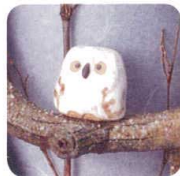
枝のりふくろう長傘立 A058-07 W230×D200×H565 ¥21,000 (税込¥23,100) ※樹脂製和紙使用