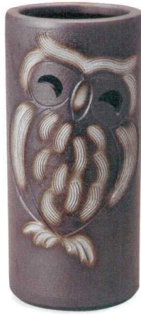
黒ほかしふくろう傘立 A058-02 W215×H460 ¥10,000 (税込¥11,000)