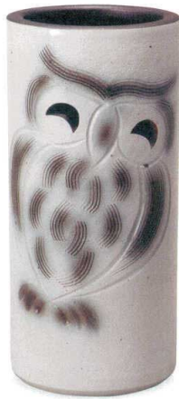
白ほかしふくろう傘立 A058-01 W215×H460 ¥10,000 (税込¥11,000)