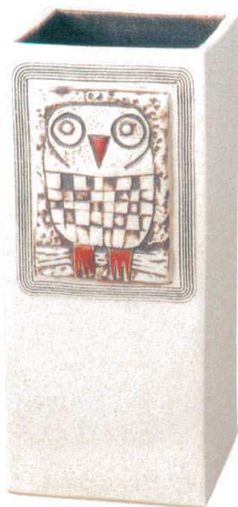
ふくろうレリーフ傘立 A059-03 W215×D230×H500 ¥20,000 (税込¥22,000)