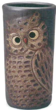
黒マットふくろう透し彫傘立 A059-02 W270×D220×H470 ¥15,000 (税込¥16,500)