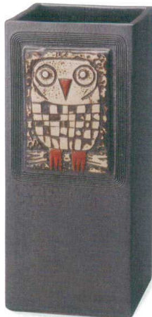
黒マットふくろうレリーフ傘立 A059-04 W215×D230×H500 ¥20,000 (税込¥22,000)