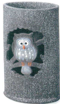
ふくろう小判型傘立 A059-05 W280×D190×H465 ¥22,000 (税込¥24,200)