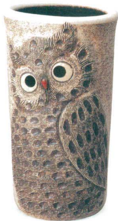
ふくろう透し彫傘立 A059-01 W270×D220×H470 ¥15,000 (税込¥16,500)