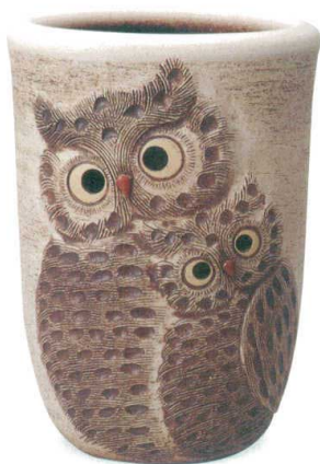
ペアふくろう透し彫傘立 A059-06 W360×D280×H480 ¥25,000 (税込¥27,500)