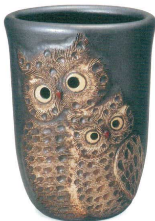
黒マットペアふくろう透し彫傘立 A059-07 W360×D280×H480 ¥25,000 (税込¥27,500)