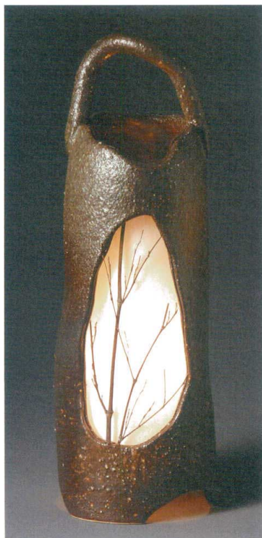
手付灯り(草ノ穂) A067-03 W160×H440 ¥17,000 (税込¥18,700)