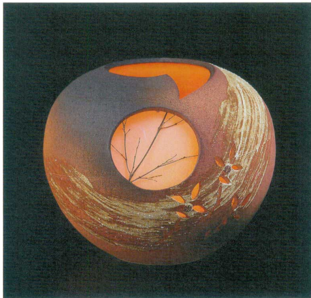
秋の月灯り A067-01 W300×H270 ¥15,000 (税込¥16,500)