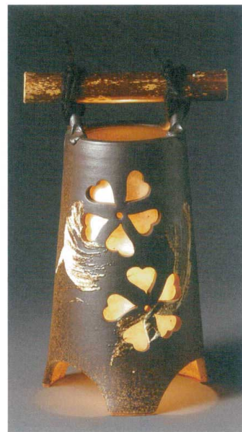
さくら灯り A067-05 W165×H290 ¥15,000 (税込¥16,500)