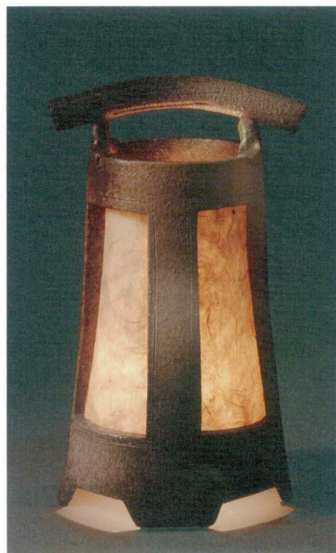
ビードロ吹灯り A067-04 W185×D170×H300 ¥15,000 (税込¥16,500)