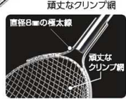
直径8mmの極太線 頑丈なクリンプ網