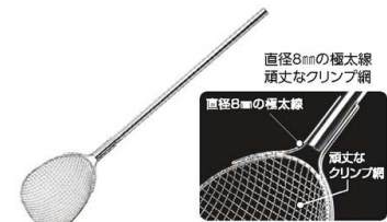
直径8mmの極太線 頑丈なクリンプ網

材質/網:18-8ステンレス 柄:18-8ステンレス ●パンチング径φ2.2mm