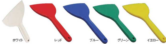
ホワイト レッド ブルー グリーン イエロー

シリコンゴムの一体成型による高い衛生面と食品衛生法に基づく検査に合格した秀れた安全性。