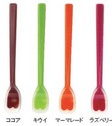
ココア キウイ マーメレード ラズベリー