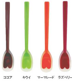
ココア キウイ マーメレード ラズベリー