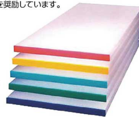
アルファ別注カラーベルトまな板(短辺片辺)

通常のみな板にピン打ち、カラーベルトの加工を施し、食材別、工程別で分けることにより更に衛生的です。