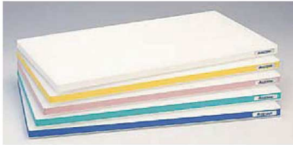
標準タイプ600×300×25mmの場合30%も軽い。