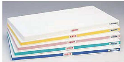
標準タイプ600×300×25mmの場合30%も軽い。

SIAAマークは、JIS Z2801に適合し、抗菌製品技術協議会ガイドラインで品質管理・情報公開された製品に表示しています。