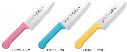
FC-620 ピンク FC-621 ブルー FC-622 イエロー