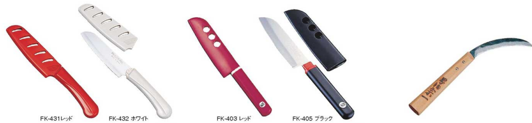
FK-431レッド FK-432 ホワイト FK-403レッド FK-405ブラック