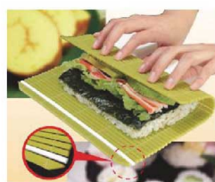
裏面はエンボス加工でご飯がつきにくい!!