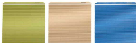
JMK-M G グリーン