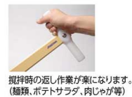
攪拌時の返し作業が楽になります。(麺類、ポテトサラダ、肉じゃが等)