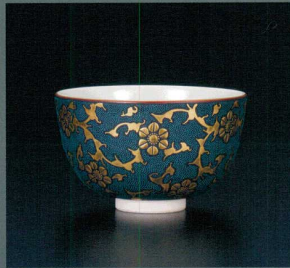
AP6-3016 抹茶碗 渦打青粒盛金鉄仙文 165,000円 (税抜価格 150,000円) 径12×高さ7.5cm・桐箱入紐通し ◆