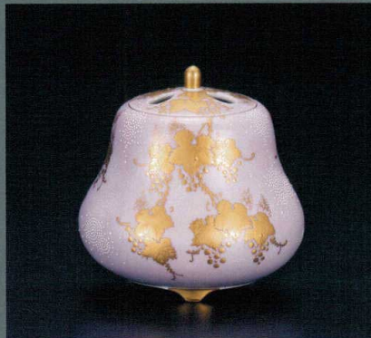
AP6-3017 4号香炉 渦打白粒盛金葡萄図 198,000円 (税抜価格 180,000円) 径11×高さ11cm・桐箱入紐通し ◆