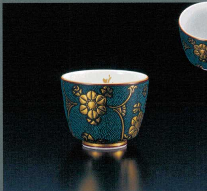
AP6-3015 ぐい呑 盛金青粒鉄仙 38,500円 (税抜価格 35,000円) 径●×高さ●cm・桐箱入紐通し ◆