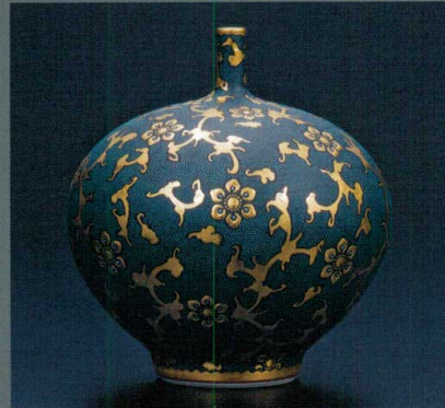
AP6-3018 6号華器 渦打青粒宝相華 440,000円 (税抜価格 400,000円) 径15.5×高さ18cm・桐箱入紐通し ◆