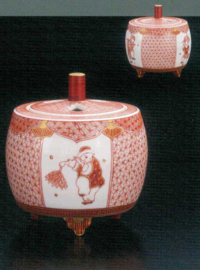
AP6-3030 3.3号香炉 からこ文 88,000円 (税抜価格 80,000円) 径9.3×高さ10cm・桐箱入紐通し ◆