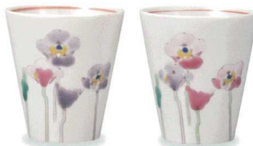
AP6-0517 組湯呑 ポピー 大志窯