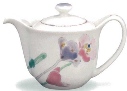
AP6-0447 ポット急須 ポピー 大志窯