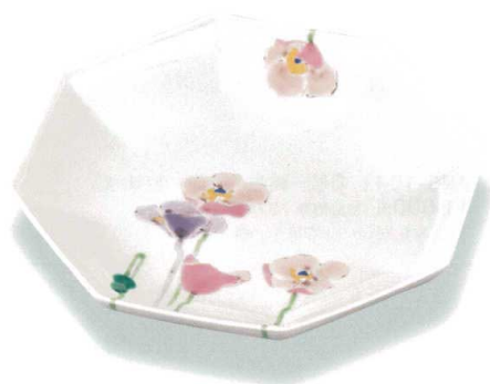
AP6-0212 8.3号盛皿 ポピー 大志窯