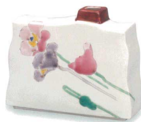
AP6-1035 5号一輪生 ポピー 大志窯 8,800円 (税抜価格 8,000円)

大志窯は、2011年に九谷焼作家 山近泰が石川県野々市市に開窯しました。 山近は、清山窯4代目として生まれながらも、独自の世界観の表現の為に自らの窯を開きました。