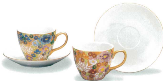
AP6-0918 ヘアカップ&ソーサー 金花詰 16,500円 (税抜価格 15,000円) 口径8.5×高さ6.7cm・容量250cc・化粧箱入 ◆

輪郭を煌びやかな金で彩色した様々な花の模様を散りばめた華やかな技法のひとつです。