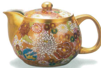
AP6-0451 ポット急須 金花詰 9,350円 (税抜価格 8,500円) 容量400cc・茶こし付・紙箱入 ◆