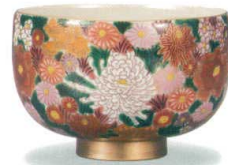
AP6-0541 抹茶碗 金花詰 8,800円 (税抜価格 8,000円) 径12×高さ8cm・木箱入 ◆