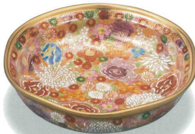
AP6-0241 6号鉢 金花詰 17,600円 (税抜価格 16,000円) 径19×高さ5.2cm・化粧箱入 ◆