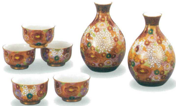
AP6-0757 酒器揃 金花詰 24,200円 (税抜価格 22,000円) 徳利 (径7.8×高さ12cm・容量240cc) 盃 (口径6×高さ3.8cm)・化粧箱入 ◆