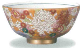
AP6-0700 飯碗 金花詰 4,950円 (税抜価格 4,500円) 径10.7×高さ5.3cm・紙箱入 ◆