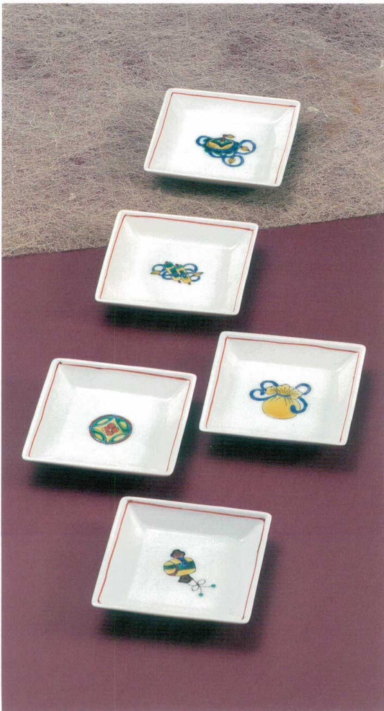
AP6-0117 4号皿揃 宝尽くし 大志窯 ◆ 8,250円 (税抜価格 7,500円) 前幅9×奥行9cm・化粧箱入 ◆