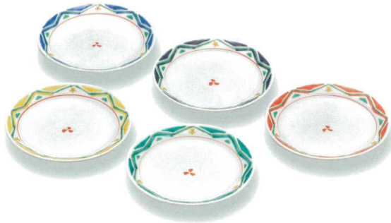
AP6-0115 5号皿揃 幾何紋色絵変わり 前田敦子 7,700円 (税抜価格 7,000円) 径16.5cm・化粧箱入 ◆