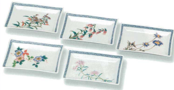
AP6-0119 7号皿揃 絵変わり草花 ◆ 8,800円 (税抜価格 8,000円) 前幅17×奥行13cm・化粧箱入 ◆