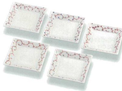
AP6-0118 3号皿揃 唐草文 幸洋窯 ◆ 8,800円 (税抜価格 8,000円) 前幅9×奥行9cm・化粧箱入 ◆