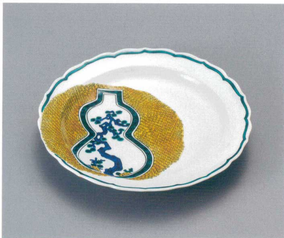
AP6-0214 8.3号盛皿 古九谷風 11,000円 (税抜価格 10,000円) 径25×高さ3.5cm・化粧箱入 ◆