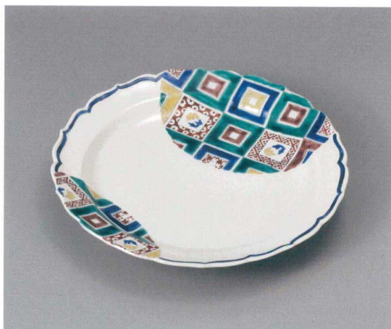
AP6-0215 8.3号盛皿 石畳の図 11,000円 (税抜価格 10,000円) 径25×高さ3.5cm・化粧箱入 ◆