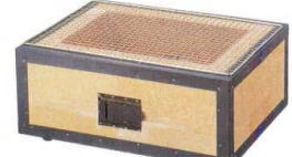
④ H-82-4 直送 炭火BBQコンロ(中)幅広4~8人用(金網付) ¥28,000 (47×35×21) 運賃別途