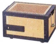
① H-82-1 直送 炭火BBQコンロ(小)幅狭 2~4人用(金網付) ¥14,800 (31×23×20) 運賃別途

※炭火の遠赤外線は熱を中まで均一に通し、じっくりと焼き上げます。また、アルカリ性の炭火は、食材の酸性タンパク質と中和して旨味を引き出します。