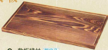
⑦ 敷板縁付 限定品 H-82-5A (大)幅広用 ¥3,200 (70×35×2)