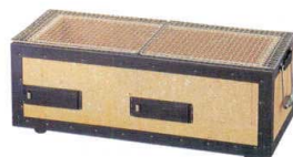
② H-82-2 直送 炭火BBQコンロ(中)幅狭 4~8人用(金網付) ¥22,700 (54×23×20) 運賃別途