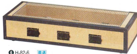
⑥ H-82-6 直送 炭火BBQコンロ(特大)幅広6~15人用(金網付) ¥49,600 (93×35×21) 運賃別途