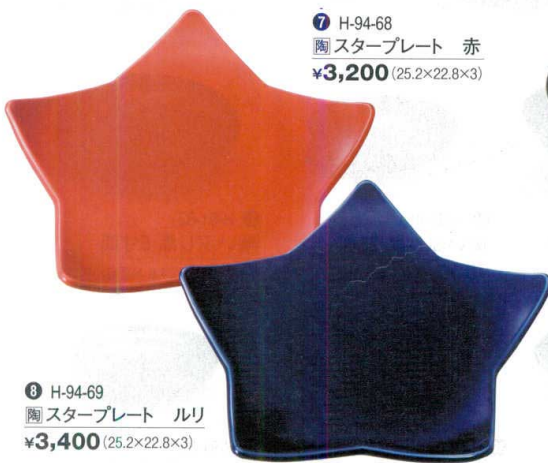
⑦ H-94-68 陶 スタープレート 赤 ¥3,200 (25.2×22.8×3)