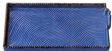
③ H-94-64 陶 スタッキング串抜き皿 灰釉測サビ ¥2,400 (23×12×2(3.5))