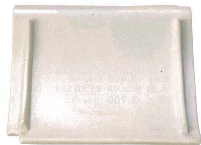
⑥ H-94-67 陶 瓦皿 白ラスター ¥4,200 (20.5×20.5×3.5)