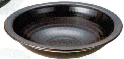
⑩ H-94-71 陶 (耐熱) 打出風土鍋 黒(大) ¥6,350 (26φ×6)