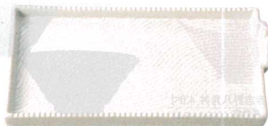
② H-94-63 陶 スタッキング串抜き皿 白マットガラス ¥2,200 (23×12×2(3.5))