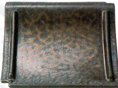
⑤ H-94-66 陶 瓦皿 金結晶 ¥4,000 (20.5×20.5×3.5)