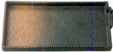
① H-94-62 陶 スタッキング串抜き皿 黒備前吹 ¥2,200 (23×12×2(3.5))