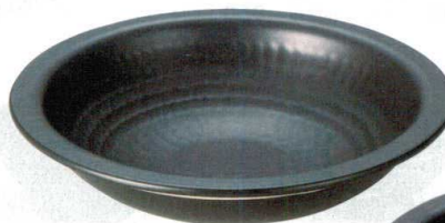
⑨ H-94-70 陶 (耐熱) 打出風土鍋 黒(小) ¥5,350 (23.5φ×6)