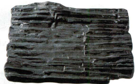
⑮ H-94-76 陶 ロッキープレート 黒砂 ¥10,000 (35×29×3.5)