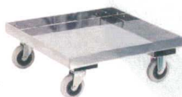
⑨ ステンレスドリー (床板付)

R-17-79 SG-9SE 直送 ¥60,000 (キャスターφ10 自在 ×2、固定×2 57×57×21H)