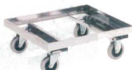
⑩ ステンレスドリー (床板ナシ)

R-17-79 SG-9SE 直送 ¥60,000 (キャスターφ10 自在 ×2、固定×2 57×57×21H)