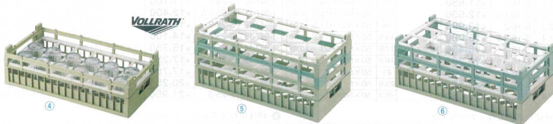
③ 10仕切りガラスラック