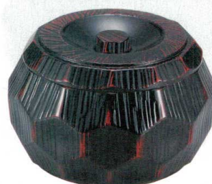
⑥ A 錦亀甲飯器 曙 U-1-69 ¥3,850 (15.1φ×9) 楕60 610cc 463g