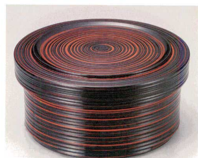
④ A 千筋飯器 曙 (1人用平なし) W-9-15 ¥3,200 (17φ×8.5・内寸14.5φ×5.1) 楕40 700cc 445g