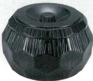
⑤ A 錦亀甲飯器 黒 U-1-68 ¥3,200 (15.1φ×9) 楕60 610cc 463g