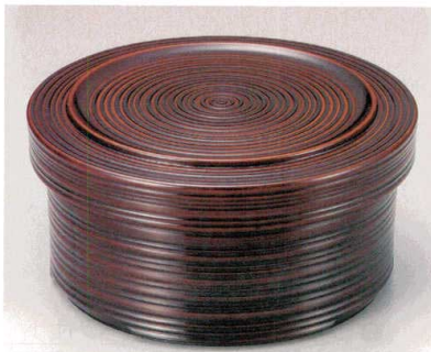
② A 千筋飯器 板 (1人用平なし) W-9-13 ¥3,000 (17φ×8.5・内寸14.5φ×5.1) 楕40 700cc 445g