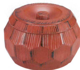
⑦ A 錦亀甲飯器 根来 U-1-70 ¥3,650 (15.1φ×9) 楕60 610cc 463g