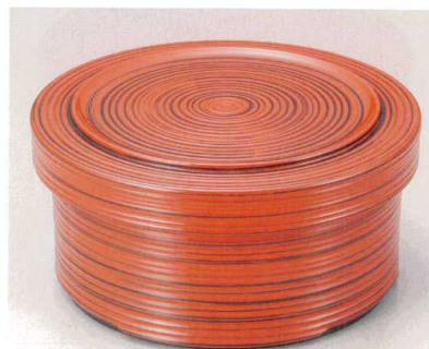
③ A 千筋飯器 根来 (1人用平なし) W-9-14 ¥3,050 (17φ×8.5・内寸14.5φ×5.1) 楕40 700cc 445g