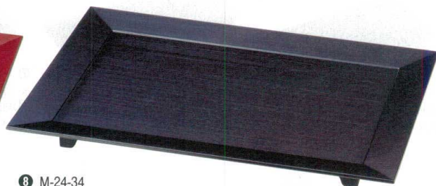
⑧ M-24-34 A 長角四方足付盛皿 黒檀底黒塗 ¥4,700 (42.4×30.8×4.7) 梱40