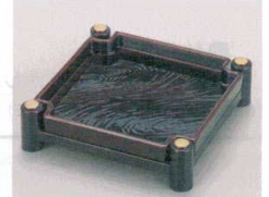
⑦ 1-630-2 角水月皿 朱木目 (本体別売) ¥2,000 (16.9×16.9×2.1) 棚50