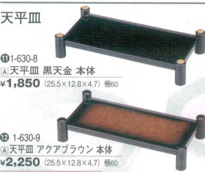
⑪ 1-630-8 天平皿 黒天金 本体 ¥1,850 (25.5×12.8×4.7) 棚60