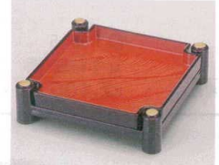
④ 1-630-24 丸竹皿 溜 (脚別売) ¥1,100 (13.2φ×3.5) 棚200