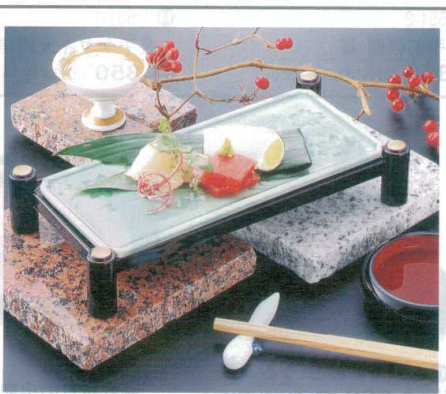
⑬ 1-630-10 陶天平皿用陶板 青春春秋 ¥2,450 (22.8×10.2×0.8) 棚40