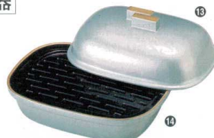
⑬ 1-642-10 [M] 小判型盛器 銀パール天金 (目皿別) ¥4,000 (19×13.8×10) 梱40