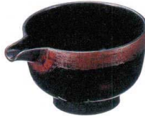
⑧ M-12-27 [A] 布張片口鉢 曙 ¥1,750 (14.5×11.8×7.9) 梱60 380cc