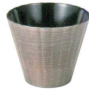
⑥ M-37-33 [PET] 菊花カップ 銀溜刷毛内黒 ¥1,200 (9.2φ×7.6) 梱100