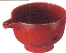
⑦ M-12-26 [A] 布張片口鉢 根来 ¥1,550 (14.5×11.8×7.9) 梱60 380cc