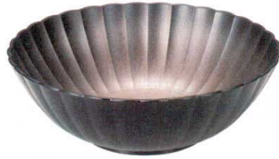
④ M-37-31 [PET] 21cm 菊花大鉢 銀溜刷毛外黒 ¥1,800 (21φ×6.9) 梱60