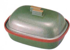
⑮ 1-642-12 [M] 小判型盛器 グリーンパール天金 (目皿別) ¥4,300 (19×13.8×10) 梱40