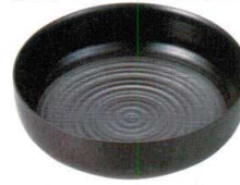
⑨ M-33-90 [A] 5寸木目乱筋小鉢 艶消新溜 ¥1,050 (15.5φ×4.5)