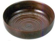
⑩ M-33-91 [A] 5寸木目乱筋小鉢 柘 ¥1,650 (15.5φ×4.5)