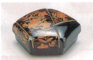
⑪ 1-643-2 [M] 結び珍味入れ 桔梗内黒天朱 ¥3,950 (15×13×7) 梱50 限定品