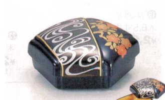
⑫ 1-643-4 [M] 結び珍味入れ 流水に桜黒内金 ¥4,350 (15×13×7) 梱50 限定品