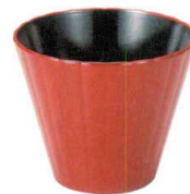
⑤ M-37-32 [PET] 菊花カップ 本朱内黒 ¥700 (9.2φ×7.6) 梱100