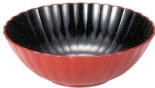
③ M-37-30 [PET] 21cm 菊花大鉢 本朱内黒 ¥1,600 (21φ×6.9) 梱60