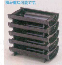
積み重ね可能です。