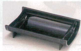
㉔ 1-494-1 A 竹取盛器 黒 ¥2,250 (22.3×13.7×5) 櫃60