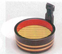
⑥ 1-540-7 A 5寸片手桶 溜金帯内朱 本体 ¥2,000 (14.8×13.9×11.8) 櫃80 (内寸φ12×H4.5)