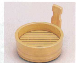
⑧ 1-540-6 A 5寸片手桶 白木金帯 本体 ¥2,100 (14.8×13.9×11.8) 櫃80 (内寸φ12×H4.5)