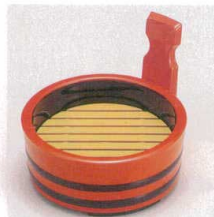
④ 1-540-5 A 5寸片手桶 朱に帯黒 本体 ¥1,750 (14.8×13.9×11.8) 櫃80 (内寸φ12×H4.5)