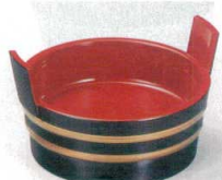
③ S-7-46 A 4寸両手桶 溜帯金 ¥1,350 (12φ×7.5) 櫃80 (内寸φ10.5×H2.8)