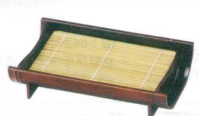
㉕ 竹取盛器 栃塗 (底板付) S-9-68 A 本体 ¥2,700 (22.3×13.7×5)