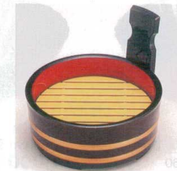
⑫ 1-540-10 A 6寸片手桶 溜金帯内朱 本体 ¥2,100 (17.5×16.7×14) 櫃60 (内寸φ14.8×H5.2)