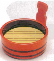
⑩ 1-540-8 A 6寸片手桶 朱に帯黒 本体 ¥1,800 (17.5×16.7×14) 櫃60 (内寸φ14.8×H5.2)