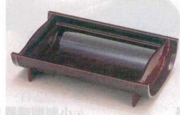
㉖ 1-494-2 A 竹取盛器 溜 ¥2,650 (22.3×13.7×5) 櫃60