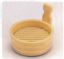
⑬ 1-540-9 A 6寸片手桶 白木金帯 本体 ¥2,150 (17.5×16.7×14) 櫃60 (内寸φ14.8×H5.2)