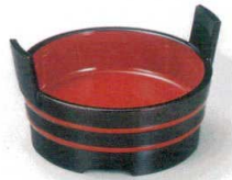
① S-7-44 A 4寸両手桶 黒帯朱 ¥1,100 (12φ×7.5) 櫃80 (内寸φ10.5×H2.8)