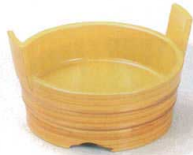
② S-7-45 A 4寸両手桶 白木帯金 ¥1,150 (12φ×7.5) 櫃80 (内寸φ10.5×H2.8)