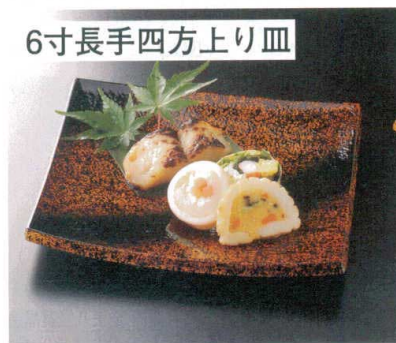
6寸長手四方上り皿