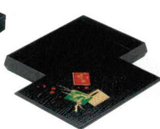
⑱ H-45-82 木ダイヤ型文庫 黒木目万年葉 (箱付) ¥11,000 (31×23.2×H5) 櫃20