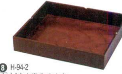
⑧ H-94-2 木(小)衣裳盆 ケヤキ ¥13,000 (45.2×39.4×8) 櫃10