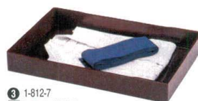
③ 1-812-7 木衣裳盆 茶乾漆 ¥16,600 (60.3×39.3×8) 櫃10