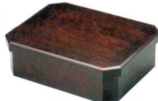
⑩ H-35-60 木角切り茶椀 ケヤキ ¥20,000 (40.5×32.5×12.5) 櫃6