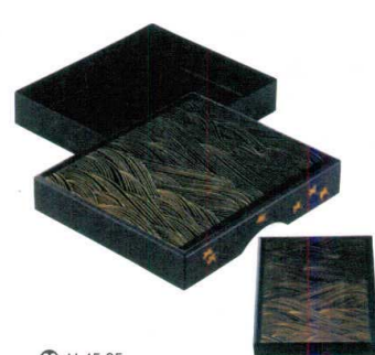
⑳ H-45-85 木長手文庫 真塗り波千鳥 蒔絵 (箱付) ¥35,000 (30×25.8×5.8) 櫃10