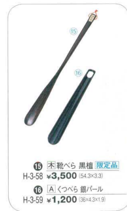
⑮ 木靴べら 黒檀 限定品 H-3-58 ¥3,500 (54.3×3.3) ⑯ A1 かつべら 銀パール H-3-59 ¥1,200 (36×4.3×1.9)