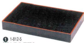
① 1-812-5 木衣裳盆 黒天朱 ¥10,000 (60.3×39.3×8) 櫃10