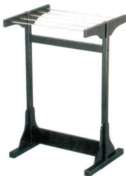
⑫ H-35-62 木タオル掛け 5本用 黒 ¥22,000 (39.3×33×60) 櫃4