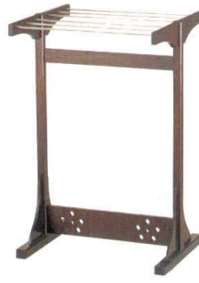
⑭ 1-809-14 木ステンレスパイプ付 6本掛 ケヤキ ¥25,000 (39×34.5×60) 櫃4