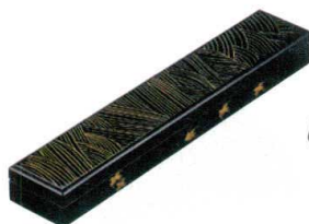
⑰ H-45-81 木筆箱 真塗り波千鳥 蒔絵 (箱付) ¥25,000 (39.5×7.4×H4.5) 櫃20