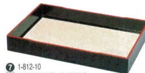
⑦ 1-812-10 木衣裳盆 (布張り) 黒天朱 ¥17,000 (60.5×39.5×7.5) 櫃10