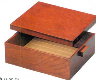
⑪ H-35-61 木長角茶椀 ケヤキ スノコ付 ¥21,000 (40.5×30×15.6) 櫃6