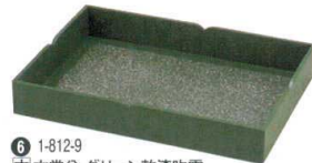
⑥ 1-812-9 木衣裳盆 グリーン乾漆吹雪 ¥21,500 (60×42.1×8.9) 櫃10