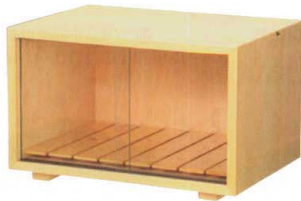
⑨ H-35-57 木フードボックス 白木 スノコ付 ¥22,500 (34×25×21.5) 櫃8