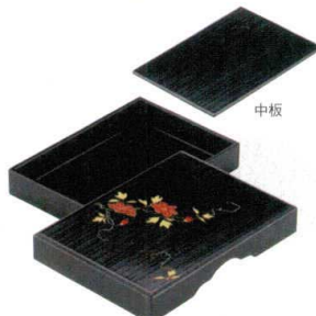
⑲ H-45-83 木視箱 新鉄仙 (箱付) 中板付 ¥9,500 (25.5×18.5×H4.1) 櫃20