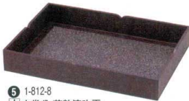
⑤ 1-812-8 木衣裳盆 茶乾漆吹雪 ¥21,500 (60×42.1×8.9) 櫃10