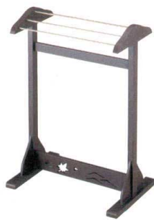
⑬ 1-809-13 木ステンレスパイプ付 5本掛 茶乾漆 ¥30,000 (41.7×27.5×57.6) 櫃4