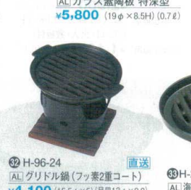
32 H-96-24 直送 AL グリドル鍋(フッ素2重コート) ¥4,100 (15.5φ×5)(目皿13φ×0.8) (コンロ別売) 強火力対応タイプ