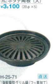
34 H-25-71 直送 AL 海鮮菊型グリル鍋(フッ素加工) ¥5,000 (19φ×5)(0.3ℓ)