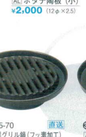
33 H-25-70 直送 AL 海鮮グリル鍋(フッ素加工) ¥5,000 (19φ×5)(0.3ℓ)