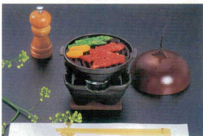
31 AL アルミグリル焼鍋 直送 H-96-23 ¥4,650 (15φ×4.5)(アルミ目皿 13.2φ)(コンロ別売)