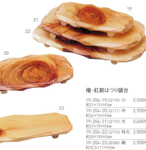
檜・紅節はつり盛台